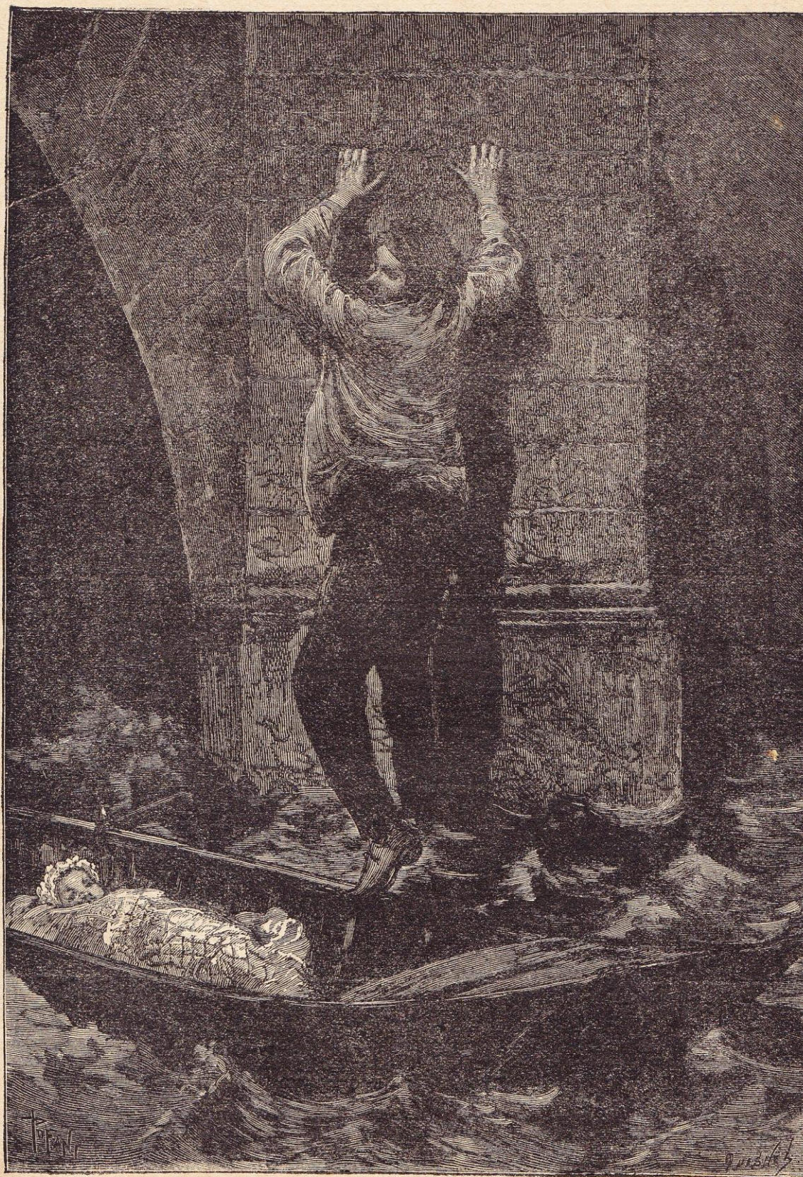
Hij is er in gelukt het bootje met eenen voet te bereiken.